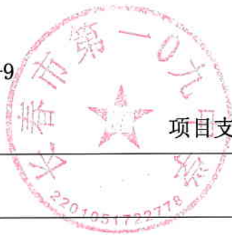
项目支出绩效目标申报表