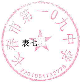
一般公共预算三公经费支出情况表