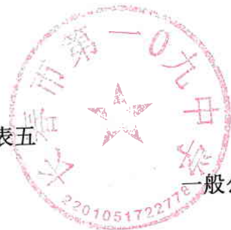
一般公共预算支出情况表（功能分类）