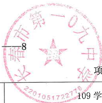
项目支出绩效目标申报表